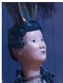
Koningin van de Nacht