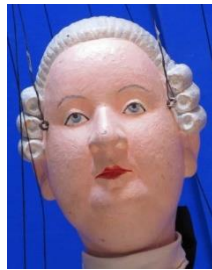
Duc de Dindon