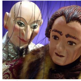
Mefisto & Doctor Faust