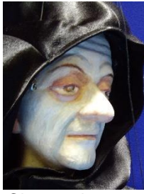
Charon de veerman