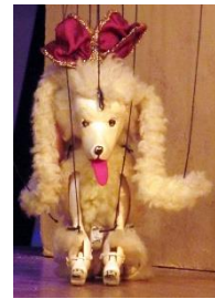
Fifi de la Rue